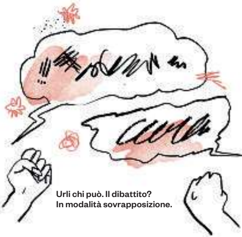
Urli chi può. Il dibattito? In modalità sovrapposizione.

L'altra faccia dell'autenticità è l'esibizione (vedi il megamatrimonio di Jeff Bezos a Venezia) e ovviamente l'arroganza. «Fino all'altro ieri, ogni parola di un capo di Stato veniva vagliata da portavoce e uffici stampa» sottolinea Motterle. «La forma era sostanza. Oggi, il presidente degli Stati Uniti litiga sui social coi suoi ex amici, sproloquia su Truth, e nessuno del suo staff lo ferma. Quando si perde la forma, non si perde solo stile: si perde controllo, autorevolezza e, alla fine, sostanza». Aveva ragione la filosofa