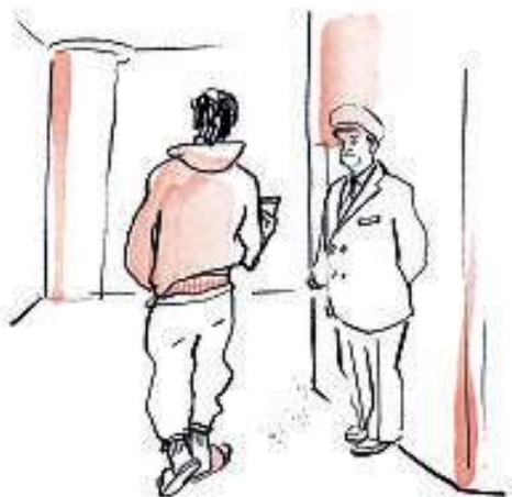
Il nuovo dress code: in pigiama, dal letto al reparto surgicali.

SEGUITO rati da non poter essere chiamati "relazioni"), il modo di comunicare, mangiare e vestire. Va tutto bene, dai jeans da minatori alle T-shirt dell'Aeronautica militare, alle felpe universitarie. L'abito da lavoro e le tute sono uniformi quotidiane e simboli globali di modernità. I miliardari indossano felpe e ciabatte (tanto non devono dimostrare niente a nessuno), mentre chiunque può permettersi una Chanel second hand, in affitto o falsa. Ci siamo abituati a man-