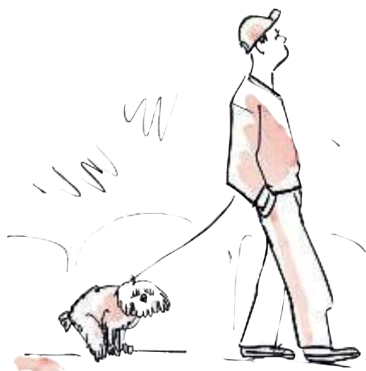
Portare a spasso il cane è facile. Se, però, lascia tracce, arriva il difficile per molti...

di Roselina Salemi - illustrazioni di Cinzia Zenocchini