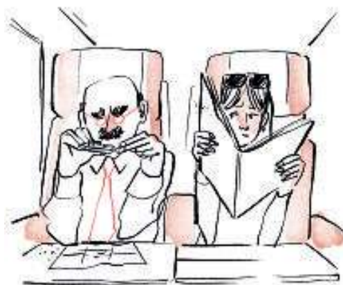
Ingannare il tempo in treno con... l'igiene personale.