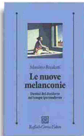
Massimo Recalcati «Le nuove melanconie» Raffaello Cortina pp. 203, € 19

Massimo Recalcati (Milano, 1959) tra i più noti psicoanalisti in Italia, insegna alle Università di Pavia e Verona e dirige l'IRPA (Istituto di ricerca di psicoanalisi applicata). I suoi libri sono tradotti in molte lingue. Fra le ultime pubblicazioni, per Raffaello Cortina i due volumi su Jacques Lacan, «Cosa resta del padre?», «Ritratti del desiderio» e «Contro il sacrificio»; «A libro aperto. Una vita e i suoi libri» e «Mantieni il bacio. Lezioni brevi sull'amore» (Feltrinelli); «La notte del Getsemani» (Einaudi)