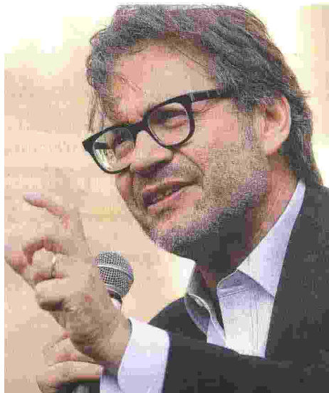
CASO GRAVE Massimo Recalcatti è psicoanalista e conduttore tv

Ritaglio stampa ad uso esclusivo del destinatario, non riproducibile.