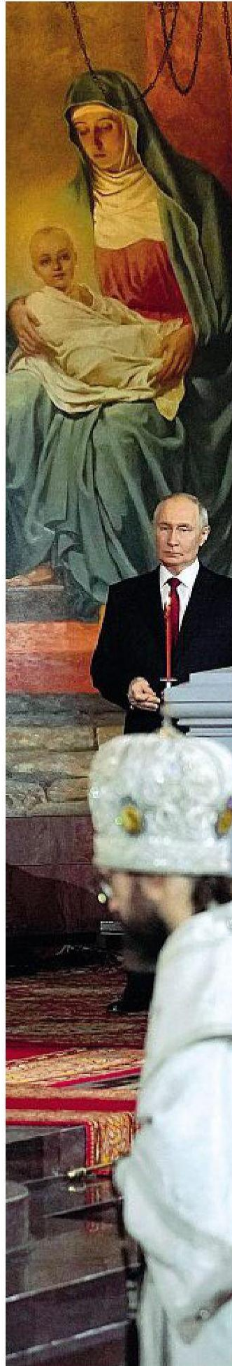
Vladimir Putin (San Pietroburgo, 7 ottobre 1952) alla messa di Pasqua a Mosca