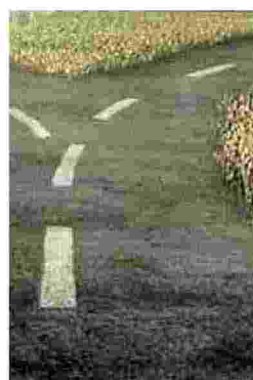
Elaborazione fotografica di MAX FRIGIONE

di Ceruti/Bellusci e di Morin. Anche Pimi si riferisce alla nostra epoca come "epoca della complessità" e, proprio per questa inedita dimensione strutturale, parla di "disagio della complessità": un concetto che è ormai parte integrante sia delle scienze dello spirito che delle scienze della natura. Ci siamo lasciati alle spalle la classica concezione aristotelica del sapere come "episteme" (un sapere caratterizzato da conoscenze certe, leggi causali stabili e uniformità dei processi), sicché la sensazione, chiarisce Pimi, "di essere completamente in balia delle «leggi del caos»" guida ormai non solo il lavoro dello scienziato sociale, ma anche quello del suo collega in laboratorio". D'altronde, la disputa accessissima tra i virologi nell'interpretazione del Covid (sul suo grado di rischiosità e sull'efficacia dei metodi con cui combatterlo) non è forse una riprova non solo del pluralismo delle ipotesi come dato costitutivo di una comunità scientifica, ma soprattutto delle conseguenze provocate dalla difficoltà a mappare/decifrare la complessità?