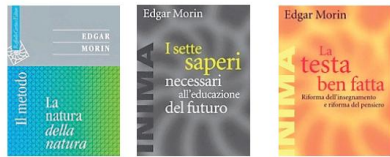
I libri principali di Edgar Morin includono "Il metodo", "I sette saperi necessari all'educazione del futuro" e "La testa ben fatta"

to per non cadere nelle grinfie della Gestapo, che conserverà per sempre. Nel '44 partecipò alla liberazione di Parigi, e l'anno successivo svolse il ruolo di responsabile dell'Ufficio propagandista del governo militare. Esperienze quelle di «soldato della Resistenza», insieme a svariate altre, che ne hanno fatto un intellettuale lonta-