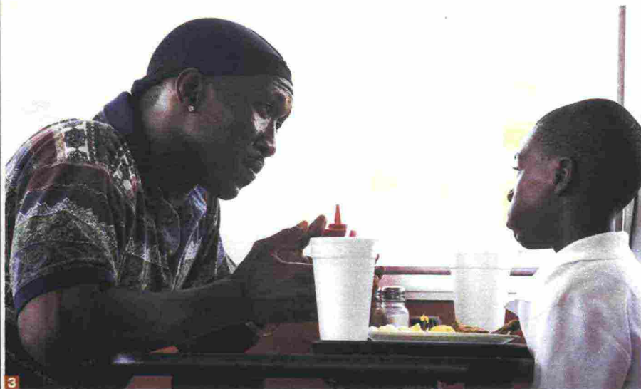
1 Jeanne Moreau, Henri Serre e Oskar Werner in Jules e Jim (1962) di François Truffaut 2 Liza Minnelli in Cabaret (1972) di Bob Fosse 3 Mahershala Ali con Alex Hibbert in una scena di Moonlight (2016), diretto da Barry Jenkins