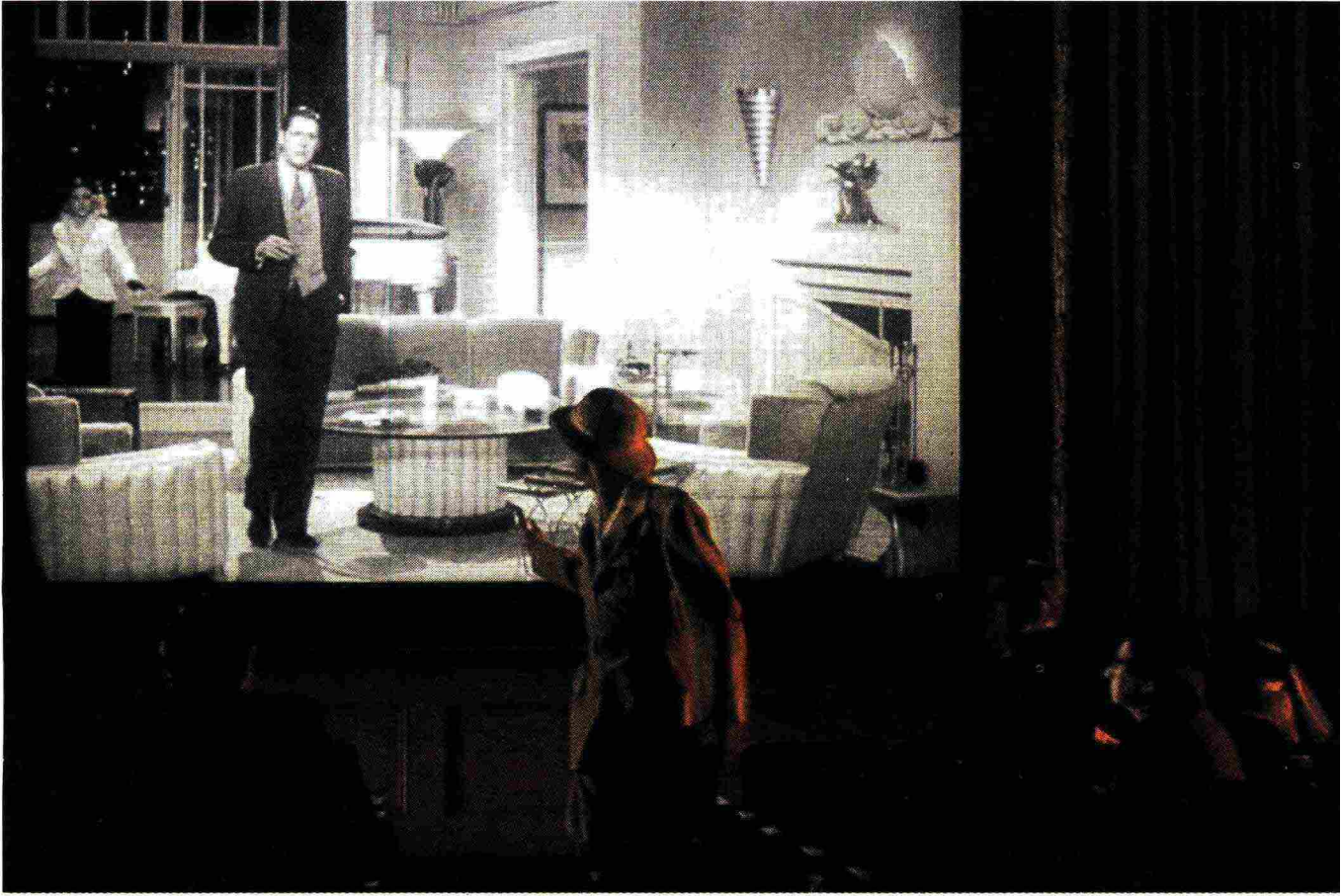
«La rosa purpurea del Cairo» di Woody Allen (1985); sotto: Jeanne Moreau in «Jules et Jim» di François Truffaut (1962)