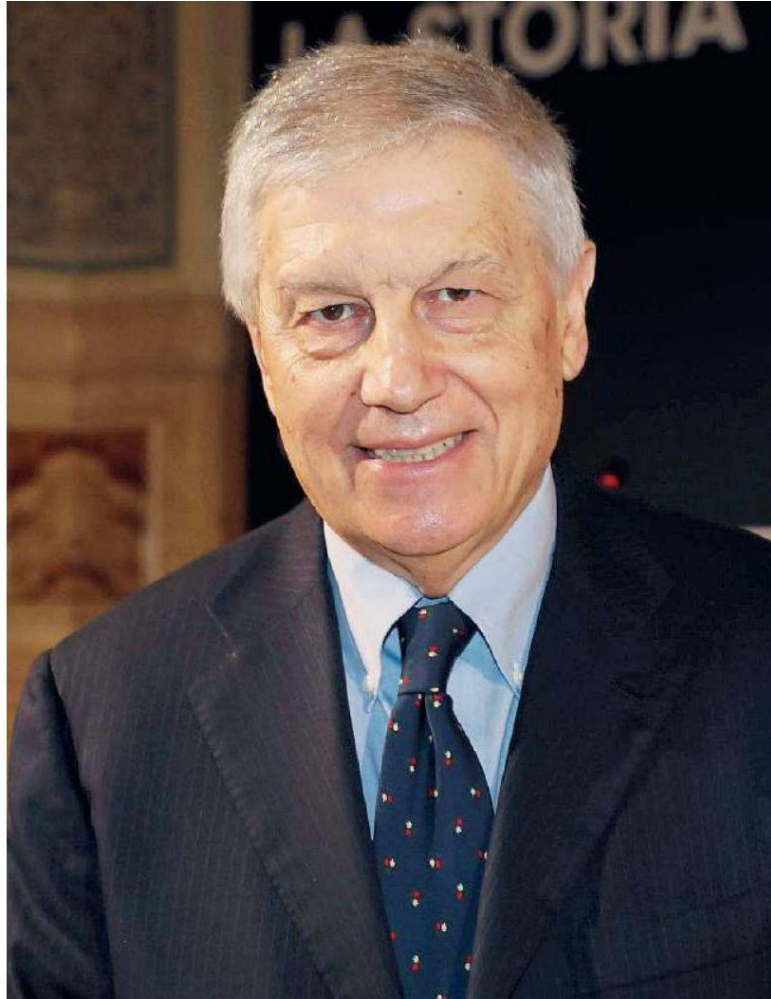
Il critico televisivo Aldo Grasso

La proprietà intellettuale è riconducibile alla fonte specificata in testa alla pagina. Il ritaglio stampa è da intendersi per uso privato