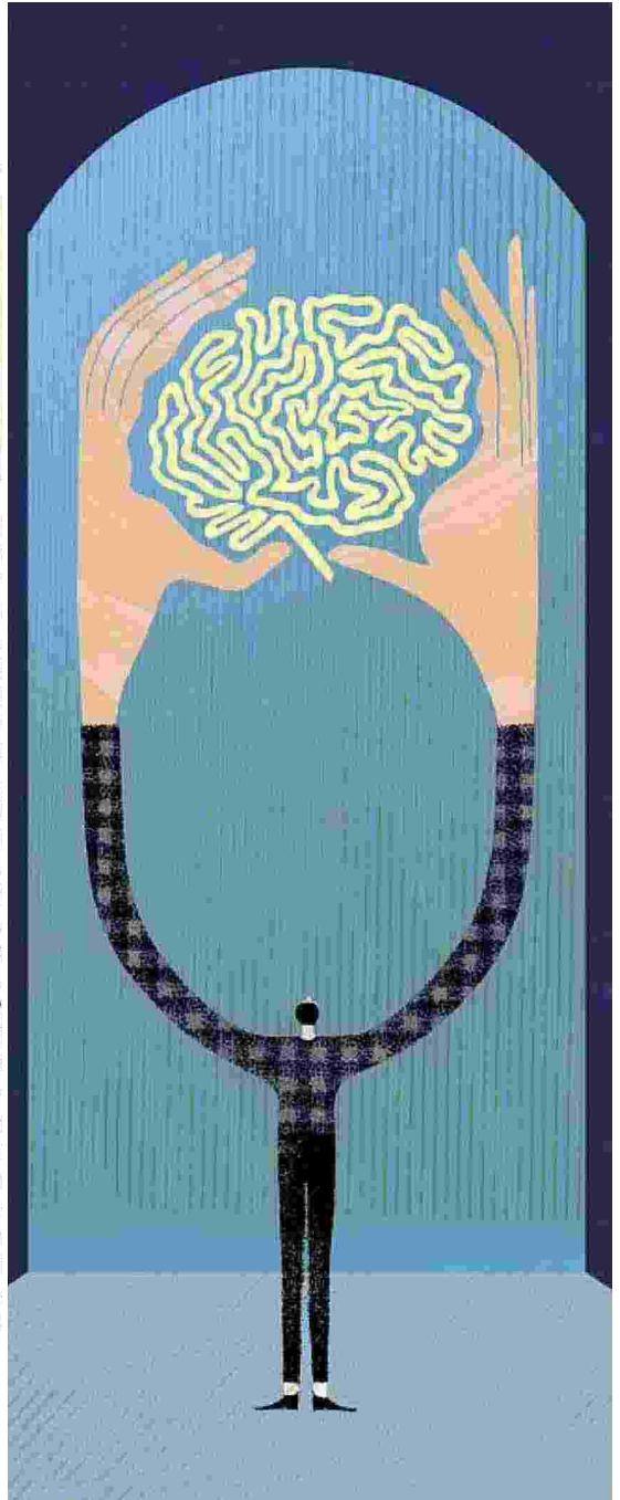
ILLUSTRAZIONE DI ANNA RESMINI

Ritaglio stampa ad uso esclusivo del destinatario, non riproducibile.