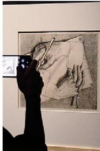
«Mani che disegnano» di Escher

«Non dobbiamo dimenticare un fatto inedito che ha prodotto una profonda discontinuità nella storia umana. L'impiego dell'arma atomica su Hiroshima e Na-