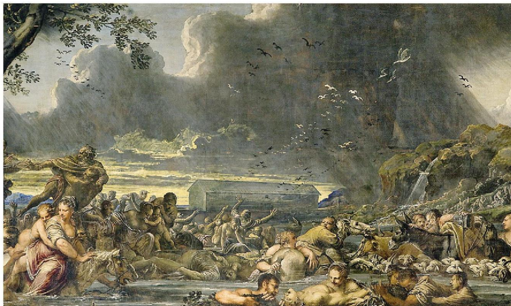
Pietro Liberi, «Diluvio Universale» (1661), Basilica di Santa Maria Maggiore, Bergamo (particolare)