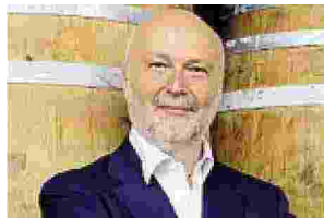
Il filosofo Mauro Ceruti

Nel suo nuovo libro «Umanizzare la modernità» Mauro Ceruti invita a un progresso ecologico integrale oltre che tecnico. DIGNOLA A PAGINA 39