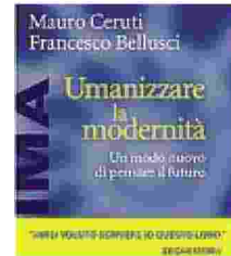
Il suo ultimo libro, sulla modernità

Ritaglio stampa ad uso esclusivo del destinatario, non riproducibile.