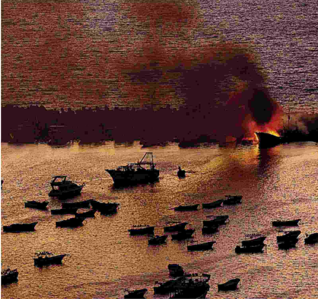
Israele all'alba ha bombardato il porto di Gaza