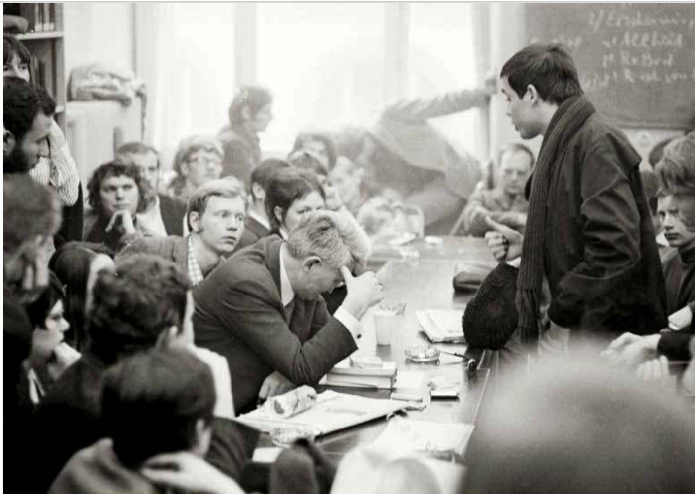
La proprietà intellettuale è riconducibile alla fonte specificata in testa alla pagina. Il ritaglio stampa è da intendersi per uso privato

N on è facile per chi, come l'autore di queste pagine, è stato al tempo stesso amico di Jürgen Habermas e talora in dissenso con lui, parlarne adesso che non è più tra noi e non può più litigare e scherzare con lui, come quando era ospite con la moglie Ute nella mia casa a Roma, o quando eravamo a dibattere in un convegno a New York.