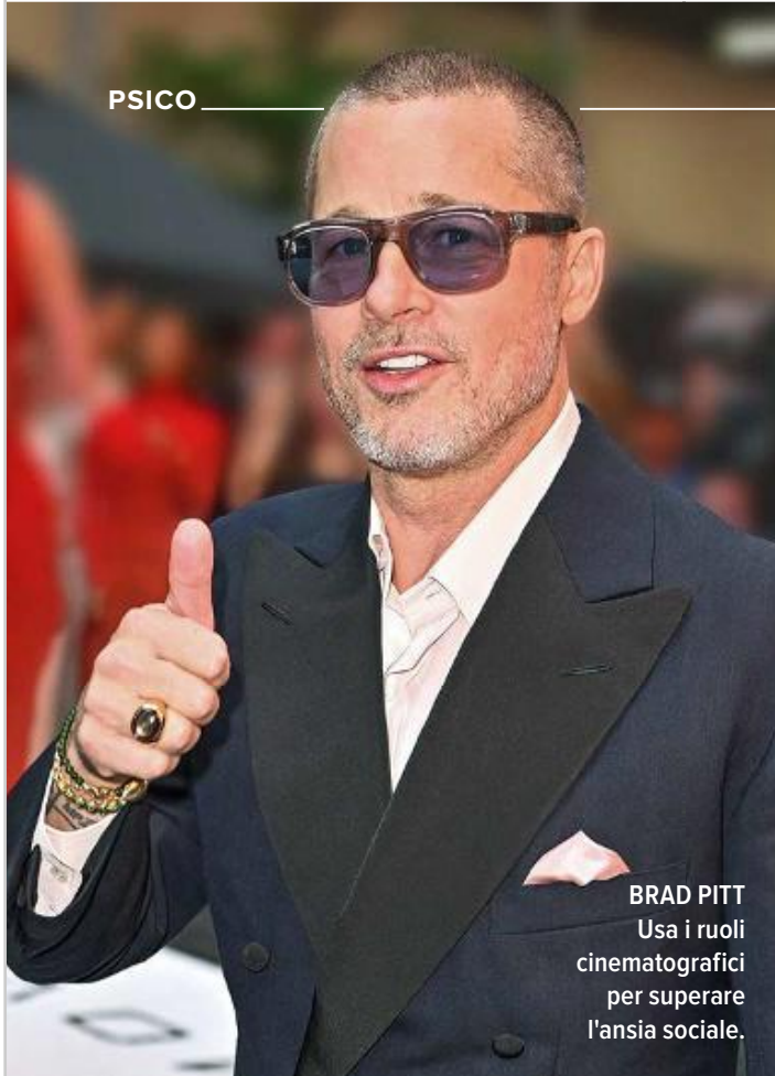
BRAD PITT Usa i ruoli cinematografici per superare l'ansia sociale.