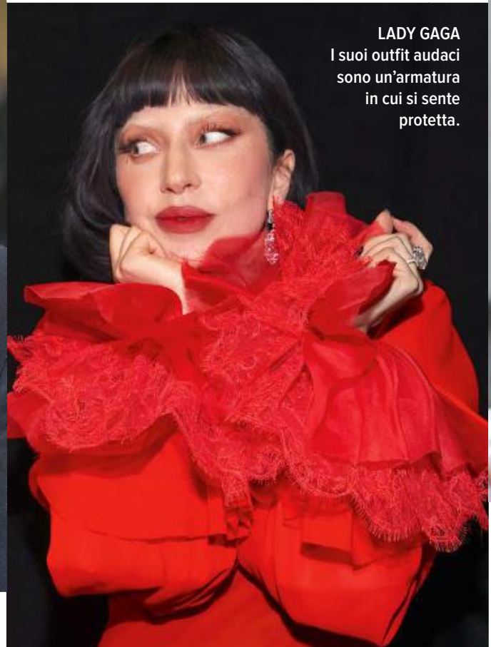
LADY GAGA I suoi outfit audaci sono un'armatura in cui si sente protetta.