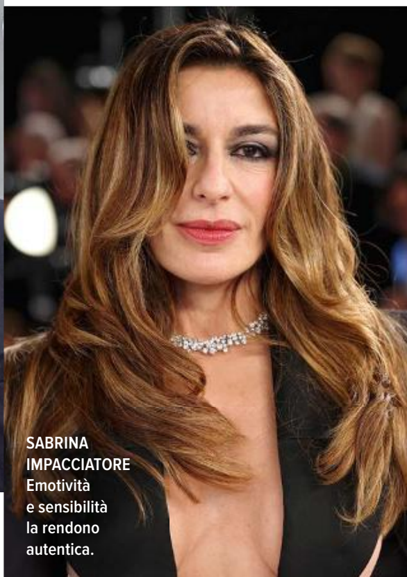
SABRINA IMPACCIATORE Emotività e sensibilità la rendono autentica.